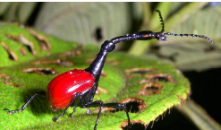
Der Giraffenhalskäfer & der Katta Lemur sind endemisch auf Madagaskar